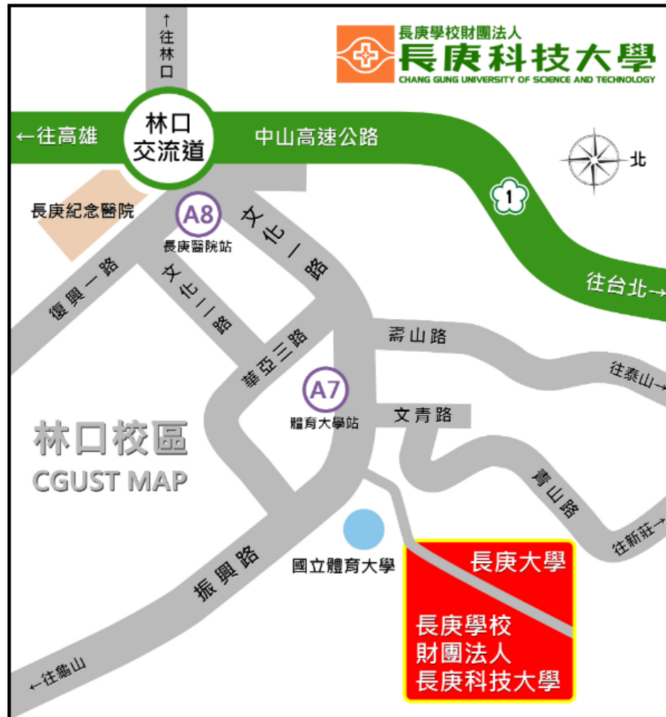
林口校區地理位置